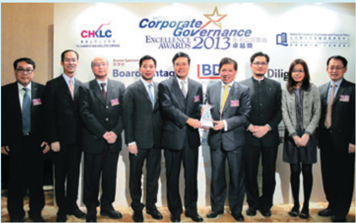
▲ 港華燃氣榮獲2013香港公司管治卓越獎 — 恒生綜合指數成份股公司類別 (2013)