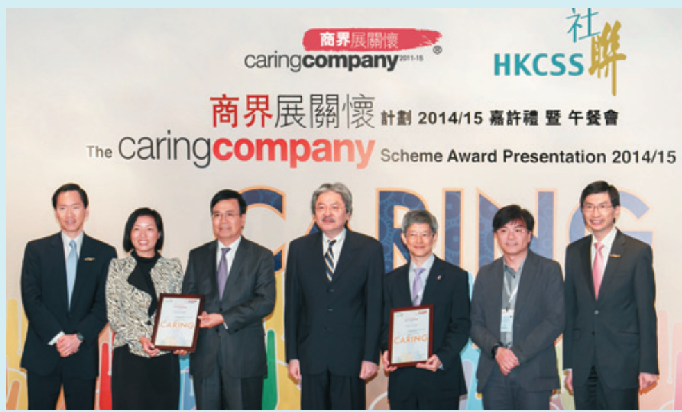
◀ 香港社會服務聯會： 商界展關懷 — 傑出伙伴合作計劃獎 2014/15 (2015)