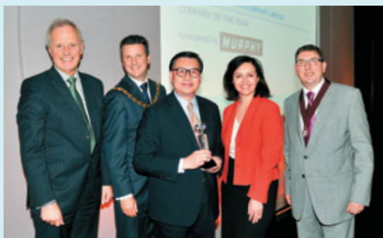
▲ 英國燃氣專業學會與能源及公用事業 聯盟：最佳燃氣公司 (2014)