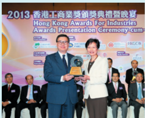
▲ 香港工商業獎： 創意大獎 (2013)