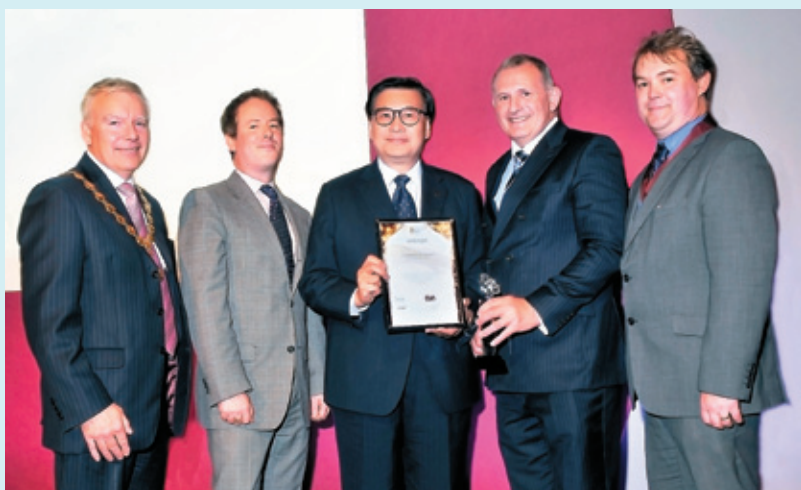
▲ 英國燃氣專業學會與 能源及公用事業聯 盟：2015年燃氣行業 獎之最佳領袖獎 (2015)