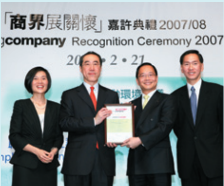
▼ 香港社會服務聯會： 商界展關懷 — 全面關懷大獎 (2008)