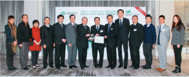
▼ 香港綠色企業大獎2014 「超卓環保安全健康獎」 白金獎 (2014)