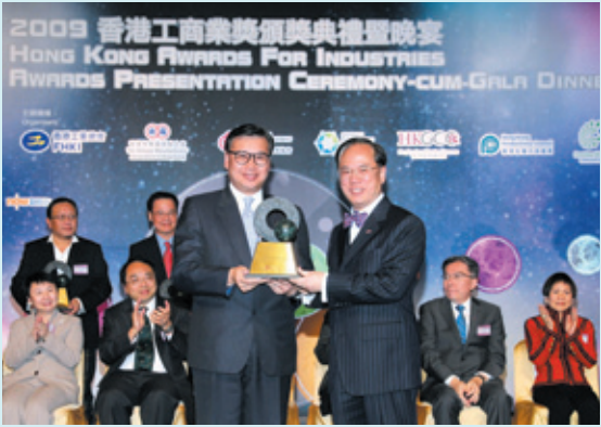
▲ 香港工商業獎： 顧客服務大獎 (2009)