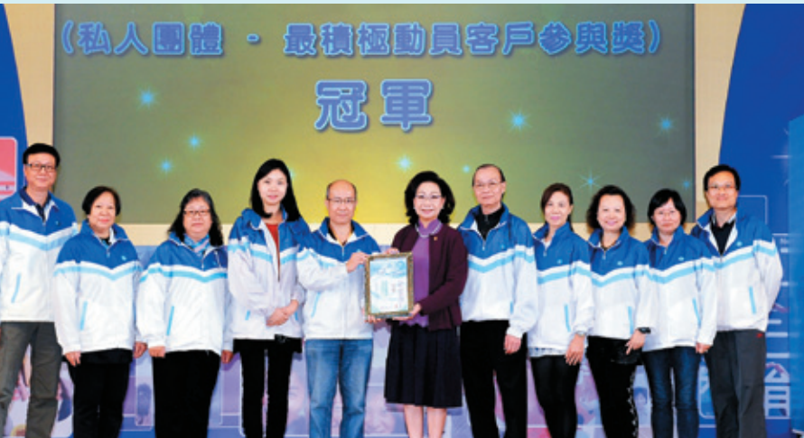
◀ 社會福利署最高服務時數獎 (私人團體 — 最積極動員 客戶參與獎) 冠軍 (2007-2014)