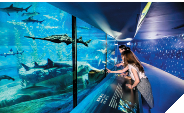
海洋公園鯊魚館採用高效能煤氣吸收式空調機，供應冷熱水作池水恒溫用途，節能又環保。

煤氣高效冷凝式熱鍋爐的效率較傳統熱水爐高逾30%，自推出以來深受客戶歡迎。不少需要大量熱水供應的場所，例如酒店、醫院、室內游泳池等，也使用這款熱鍋爐。