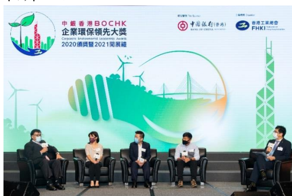
煤气公司常务董事陈永坚（左一）于中银香港企业环保领先大獎 2020 颁奖典礼上分享公司在可持续发展的成功之道。