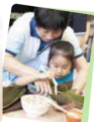
煤氣公司義工教導小朋友包裹低碳糴。