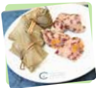
煤氣公司特別推出自創的低碳糴，推廣綠色飲食文化。

今年是煤氣公司連續第14年舉辦「萬糴同心為公益」活動，公司與近240位立法會議員、區議員及20多個地區團體合作，動員全港18區義工合力包裹23萬隻低碳糴送予社區上有需要人士，為社區添上溫暖及關懷。