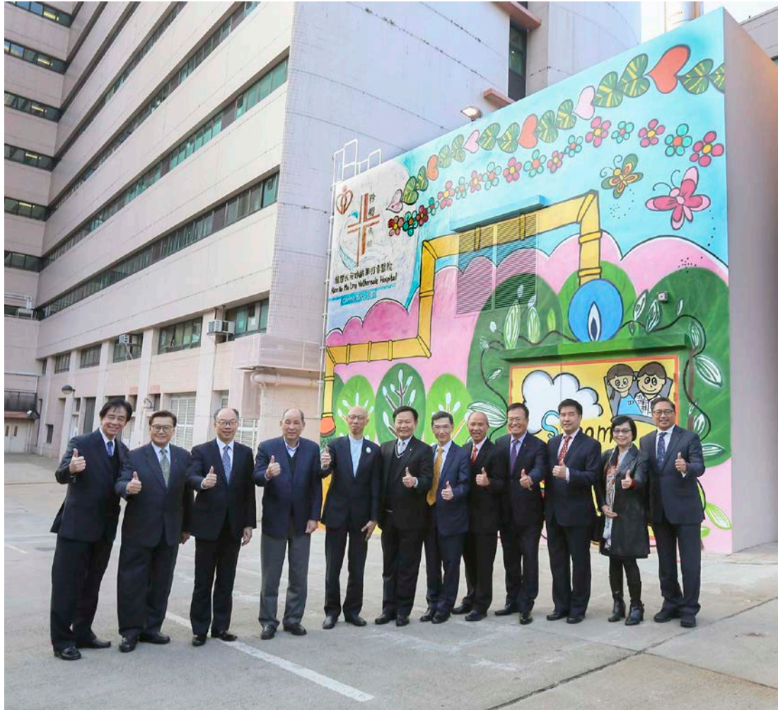
環境局局長黃錦星(左五)、醫院管理局行政總裁梁栢賢醫生(左六)、雅麗氏何妙齡那打素醫院及大埔醫院醫院行政總監文志賢醫生(右五)、煤氣公司常務董事陳永堅(左二)、執行董事暨公用業務營運總裁黃維義(右四)，以及商務總監—香港公用業務黃霖生(左一)與眾主禮嘉賓合照留念。