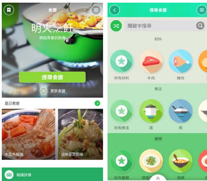
圖片 3：「精選食譜」功能為喜愛烹飪的用戶提供逾千款網上佳餚食譜，配合烹飪教學短片，只要一機在手便能輕鬆煮出健康美食。