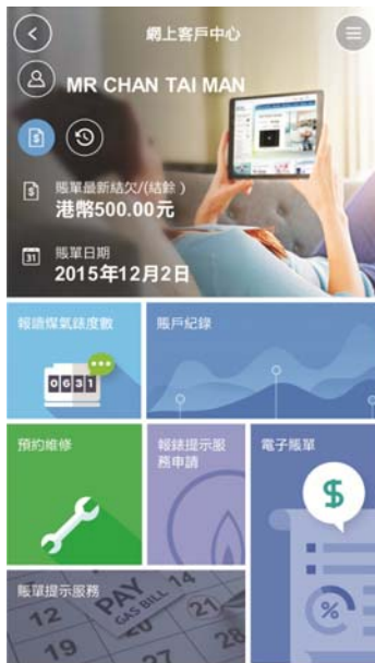
圖片 2：全新手機應用程式將電子服務升級後，用戶能隨時隨地管理煤氣賬戶和報讀煤氣錶度數，更可下載煤氣賬單 QR Code 到便利店繳費，方便又快捷。