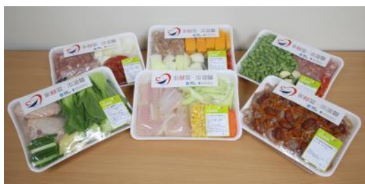
相片 5 及 6