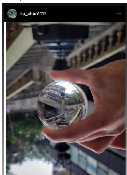
猶如在水晶球中的中環煤氣街燈。