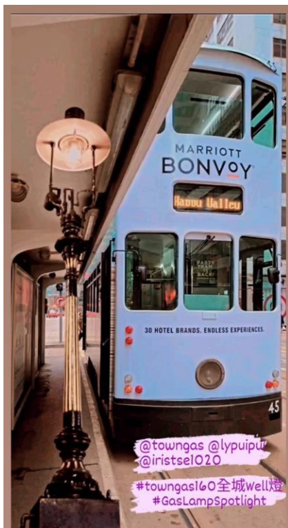
煤氣燈放到充滿歷史感的電車站非常相襯。