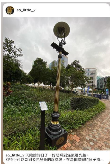
@so_little_v 說：期待下可以見到發光發亮的煤氣燈，在滿佈陰霾的日子照亮這一段路。